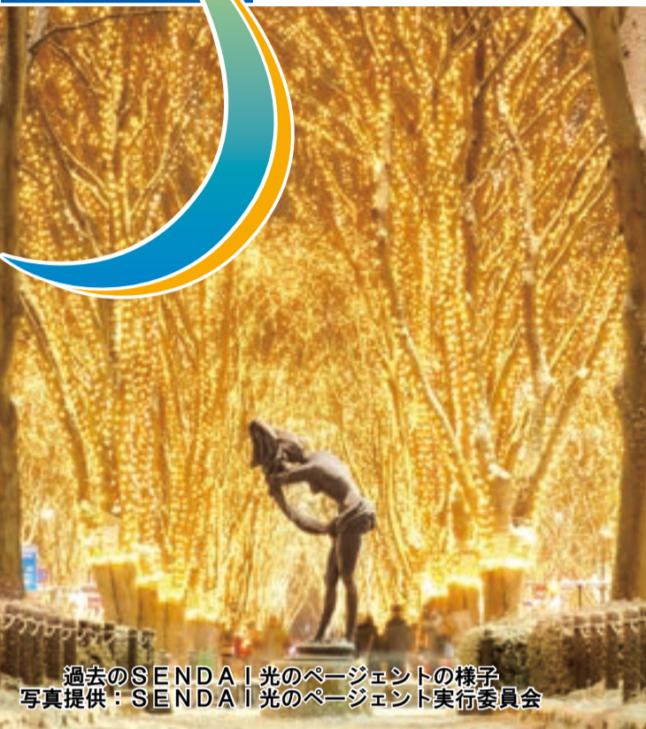
過去のSENDAI光のページェントの様子

昭和61年からスタートした仙台の冬の風物詩であり、定禅寺通がきらびやかな雰囲気に包まれます。令和5年は、定禅寺通のケヤキ129本に、約50万球のLEDがともされました。39回目となる今年には「未来へつなぐ光彩」をテーマに12月6日（金）～25日（水）までの20日間ともされます。