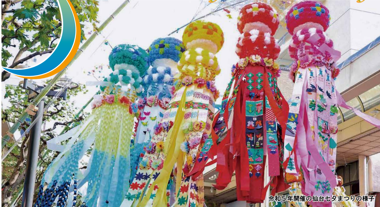
令和5年開催の仙台七夕まつりの様子