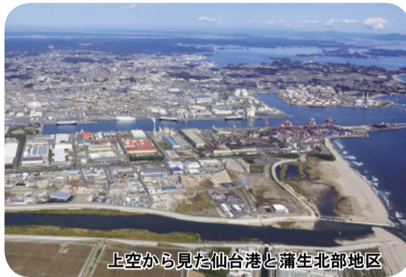
上空から見た仙台港と蒲生北部地区