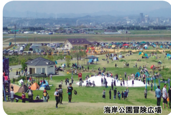
海岸公園冒険広場