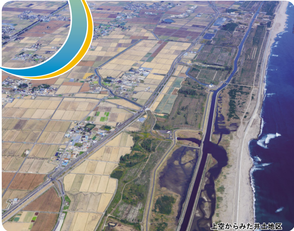
上空からみた井土地区