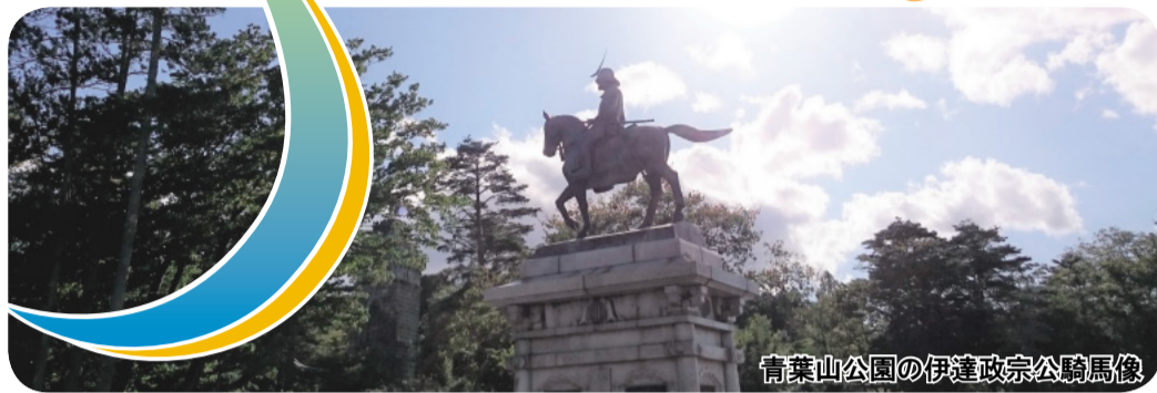
青葉山公園の伊達政宗公騎馬像