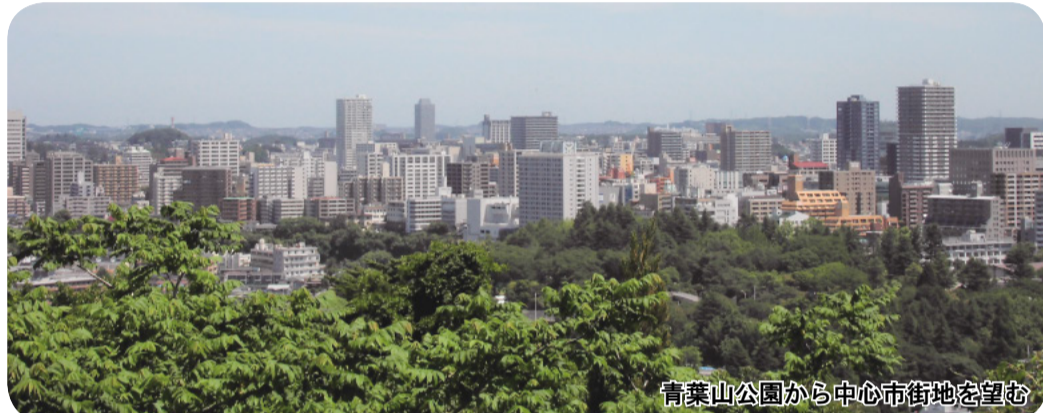
青葉山公園から中心市街地を望む