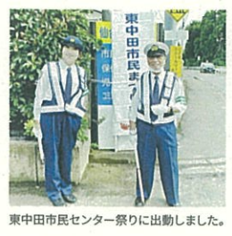
東中田市民センター祭りに出動しました。

場合、男女共通で良く、すでに市役所職員作業着も共通になっていますし、コスト削減にもつながります。交通指導隊の制服についても男女差をなくし制服のジェンダーレス化を進めるよう求めました。