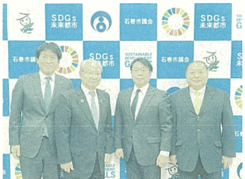
●石巻市議会を表敬訪問し、正副議長就任のご挨拶をしました。 10月3日