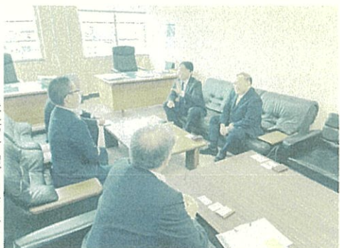
●東松島市議会を表敬訪問し、正副議長就任のご挨拶をしました。 10月3日