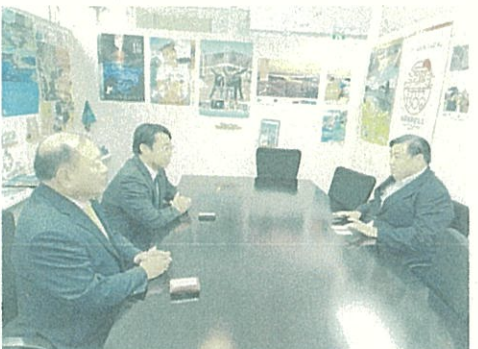
●宮城復興局長を訪問し挨拶しました。 10月3日