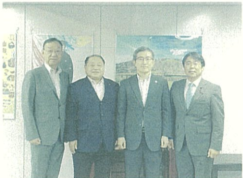
●駐大韓民国総領事に御来訪いただきました。 9月7日