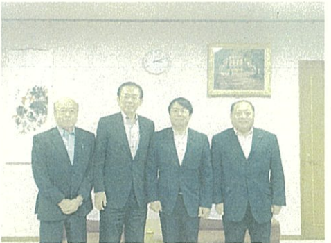
●宮城県議会に正副議長で就任の挨拶に伺いました。 9月6日