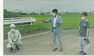
▲地域の声に応じてインフラの整備を実現していきます