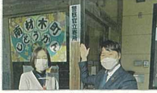
▲子どもたちを守るために、すべての児童館でステッカーを設置