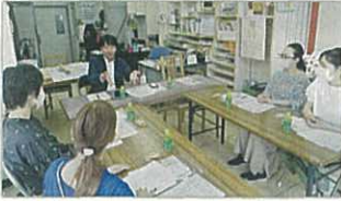
▲ママ座談会を定期的に行い、子育て世代の声を市政に反映していきます