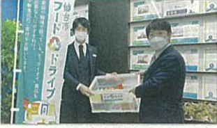
▲仙台市のフードドライブ事業 全ての人に健康的な食事を