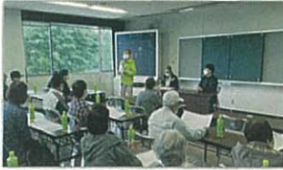
▲市民の声から今泉清掃工場をいっとき避難所として使えるよう実現しました!