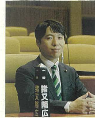
仙台市議会議員 猪又 隆広