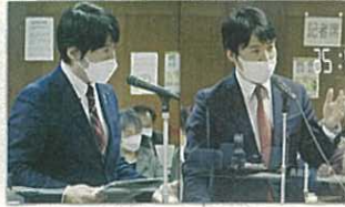
▲議会での質疑 少しでも市民の皆様の暮らしを豊かに