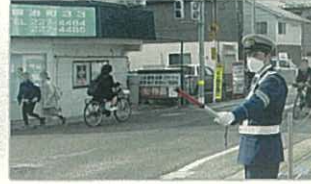
▲交通指導隊として 地域の安全安心をこれからも守ります