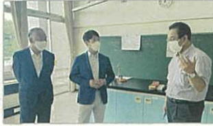
▲不登校特例校の開設 子どもたちに公平で質の高い学びを!