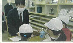
▲地域の子どもたちにも市議会議員としての仕事を伝える