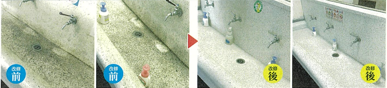
▶経年の汚れで外の洗面所と間違えるくらい汚れが酷い校舎内洗面所、業者を入れ薬剤を使用し綺麗に、13ヶ所を綺麗にしました。