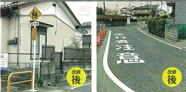
▲倒れた通学路標識を新設