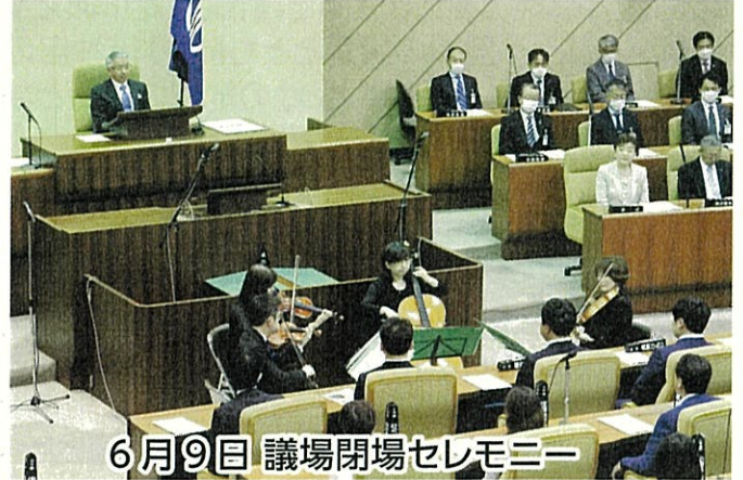
6月9日 議場閉場セレモニー

代表質疑には、新たな学生フリーパス制度、県内4病院再編問題、物価高騰対策と市立学校給食費の無償化、脱炭素の環境整備、郊外団地の活性化、障がい者差別解消条例改正など、市政の重要課題について活発な質疑が行われました。