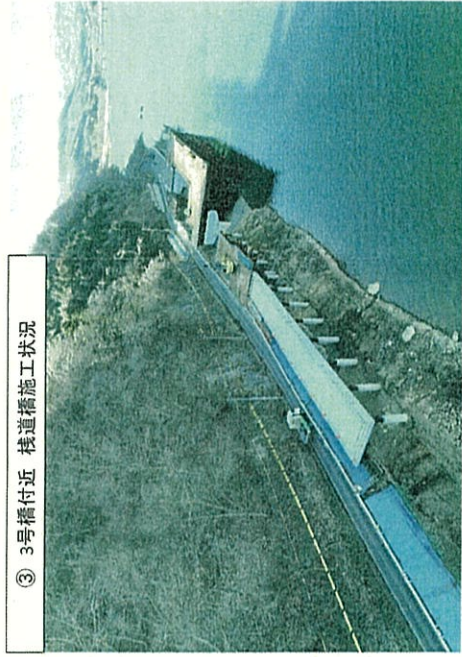
③ 3号橋付近 棧道橋施工状況