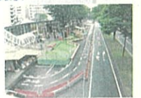
青葉通駅前エリアの社会実験視察