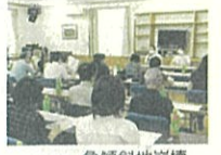
急傾斜地崩壊対策事業説明会