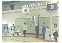
将監複合施設開館記念式・視察