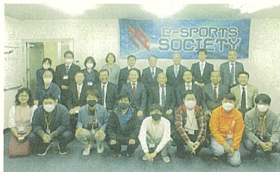
明石市の障がい者e-スポーツ協会にて

翌8日は明石市の一般社団法人障がい者e-スポーツ協会で、障がい者向けe-スポーツ大会開催の背景や事業内