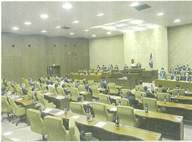
市議会本会議（コロナ対策で2/3の出席調整で開催）

また、物価高騰対 策として福祉・医療 機関等及び公共交 通・運送事業者、農 畜産業者への支援を 求め、その結果12月 の第4回定例会の一 般会計補正予算で支 援策が打ち出されま した。引き続き市政 を支え、市民生活向 上に向けて全力を投 球してまいります。