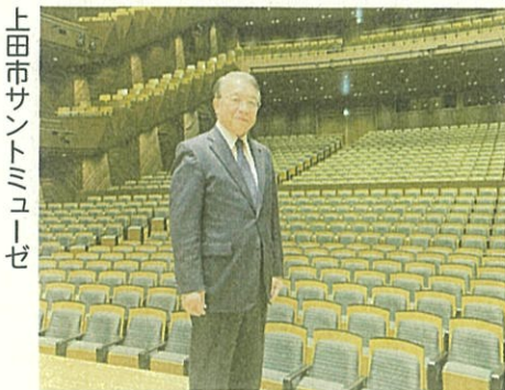
上田市サントミュージゼ

て38・2人と健闘しています。 財政状況についても、2割 の運賃等運営協議会負担(8割 は市補助)も11月の段階で19% を超え、その点でも目標達成 のめどがついてきています。