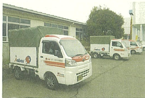
運送事業者への支援が実施

3月の福島県沖地震に伴う崩壊家屋の解体・撤去費、災害廃棄物処理費の追加も計上されました。新型コロナ対策としてはケア付き宿泊療養施設運営経費が追加されました。(補正予算の詳細は別途掲載)