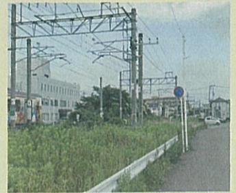
JR仙石線福田町駅は現位置から西に約200mの所に移設します。