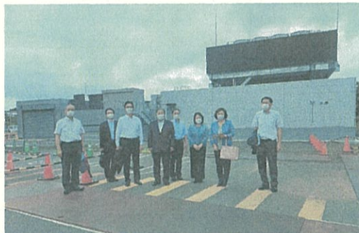
東北大学青葉山キャンパスの建設中で、2024年度本格運用開始予定の次世代放射光施設(ナノテラス)を視察しました。 [8月22日]