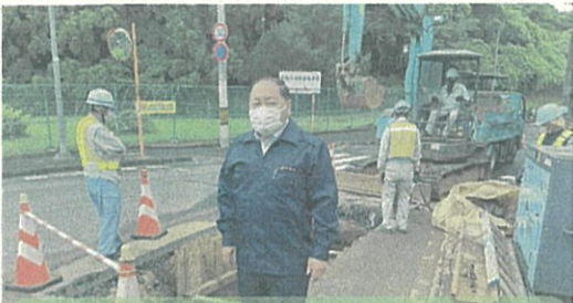
太白区日本平1-21(7月25日)に発生した下水道管に穴が開き、内管内部に土砂が流れ込み空洞化により、舗装の下が陥没した事故現場を調査視察しました。修繕工事は完了しています(8月3日)。 [7月27日]