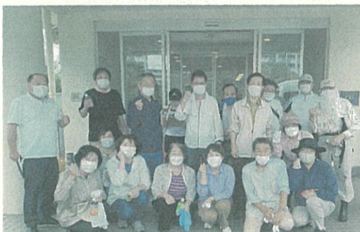
公明党太白東支部で20年以上継続している高齢者施設の、施設周辺の草刈りボランティア活動を党員の皆さんと実施。 [9月4日]