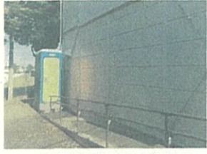
▲児童館に設置された仮設トイレ

◆ 袋原小学校のコミュニティ児童館のトイレが足りないという声があり、すぐ出来る対応で、仮設トイレを設置。恒久対策はプレハブ更新時に標準設置します。