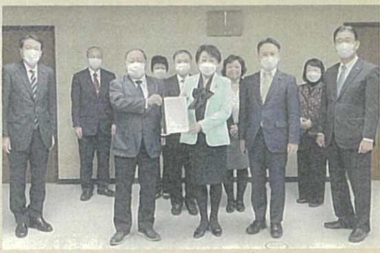
公明党仙台市議団として仙台市長に 令和5年予算要望を提出(11月2日)