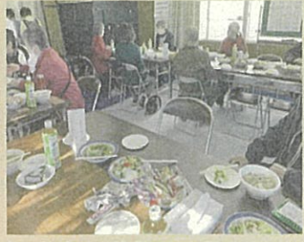
町内会の秋祭りに参加(10月30日)