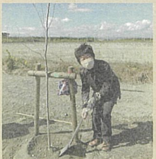
ふるさとの杜再生プロジェクト 植樹祭に参加(10月29日)

横断歩道手前に立つと車が見えない、児童生徒の目線だと更に見えづらい、とのご相談を頂き、鶴ヶ谷東小学校前の大木を伐採し、見通しが良くなりました。