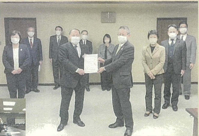
公明党仙台市議団として「不適切な事務処理を繰り返さぬことと損失回復を求める」緊急申し入れを提出(12月1日)