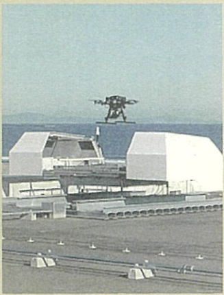
津波避難広報ドローン デモンストレーション飛行に 参加(10月29日)