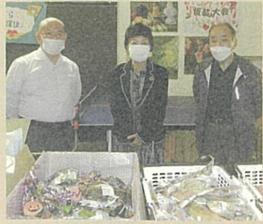
ハロウィン(10月31日) 地元で放課後デイサービスを運営している 「からくら児童館」へNPO法人からお菓子の差 し入れがあり、橋渡し役として同席しました。