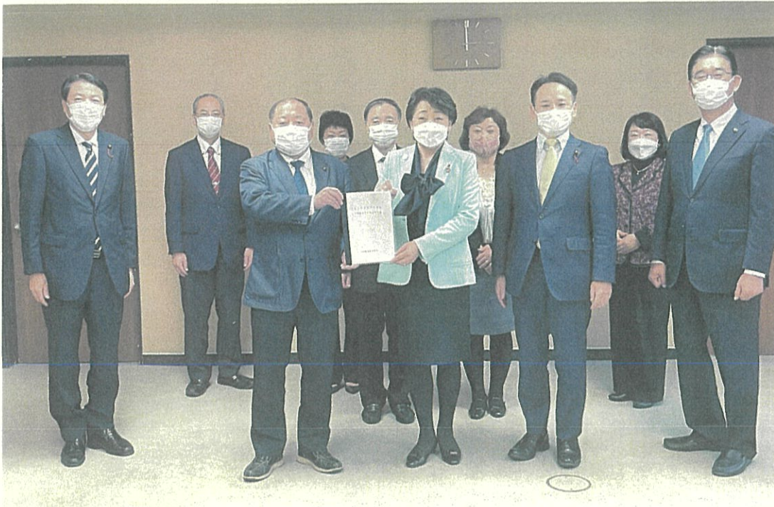
令和5年度仙台市予算及び制度改正に係る要望書を郡市長に手渡す仙台市議団 (2022年11月2日)

「大衆とともに語り、大衆とともに戦い、大衆の中に死んでいく」との立党精神を掲げ今年で満60年の公明党から公認された議員9人で構成された仙台市議会の会派が、わたしたち「公明党仙台市議団」です。