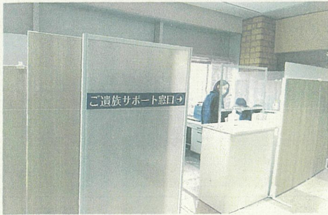
昨年試行開設された若林区の「ご遺族サポート窓口」 (2021年12月3日視察)

ご家族が亡くなられた際に必要な各種手続きや持ち物など、何度も足を運ばなくて済むように