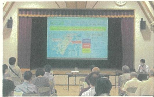
宮城野区内で行われた市民説明会から