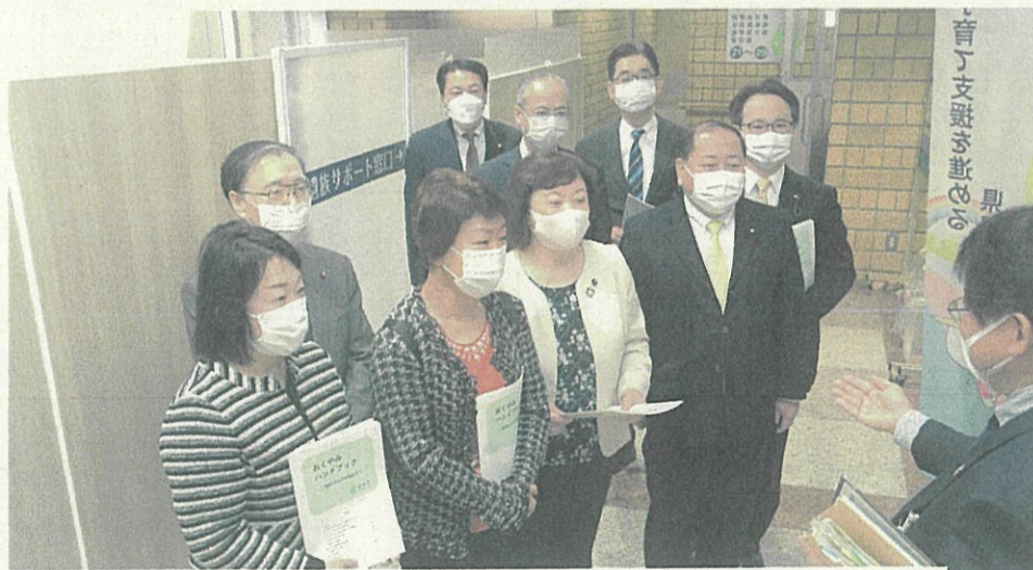
窓口の前で説明を受ける公明党市議団

きを行います。なお、ご予約をせず利用することもできますが、その際は、ご遺族サポート窓口で市ホームページに公開中のナビゲーションサイトを「仙台市手続きガイド」を用いて必要な手続きと窓口をご案内致します。