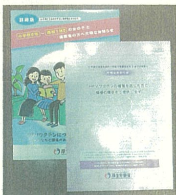
HPVワクチン①と キャッチアップ接種②の案

そのほか、ギャンブル依存症対策（民間団体との連携、ネットギャンブルへの周知強化、予防教育など）を迫りました。