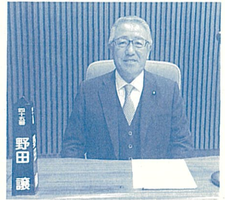
▲仙台市議会議場にて

今回のレポートは、自由民主党の代表質疑の質問と答弁の一部を記載させていただきました。是非、一読いただき皆様の仙台市政へのご意見を頂戴したいと考えております。