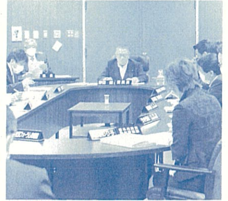
▲写真は、議会初日の開会前に開催された議会運営委員会

今回のレポートは、会派自由民主党 代表質疑の主な答弁を記載させていただきました。是非、一読いただき皆様の仙台市政へのご意見を頂戴したいと考えております。