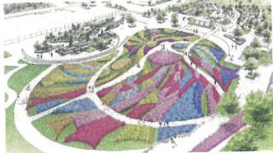
仙台都市緑化フェア 4月26日より開催

郡市長 新年度に向けましては、スタートアップの支援など、幅広い人材の交流と新たな価値の創出により、人と投資を呼び込む、地域経済の活性化を図っていきますとともに、子育てが楽しい社会の実現や、孤立・貧困といった課題への対応など、このまちの未来を開く、一人一人の挑戦と活躍を支えるまちの実現に力を尽くしてまいりたいと考えております。