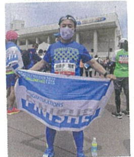
昨年は5月8日。 今年は6月4日に。

文化観光局長 有力選手の招聘や、SNSを活用したプロモーションなどを通じ、今後とも国内外の多くのランナーから選ばれる、国内最高峰のハーフマラソン大会であり続けられますよう、関係の皆様とともに力を尽くしてまいります。