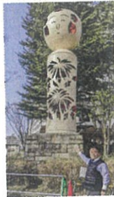
西公園こけし塔を指摘