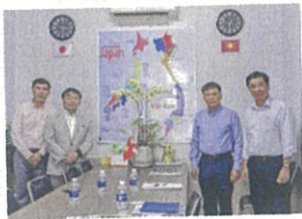
介護外国人材の調査 (ホーチミン)

まずは、積極的に取り組んでいる事業者との意見交換等を通じて、本市が中心となって連携のあり方を検討するとともに、地域一体となって送出機関への働きかけを強める方策につき、保険者として、県とも連携し探ってまいります。