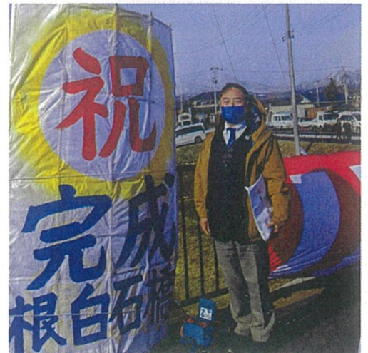
クリスマスの日に根白石橋が開通