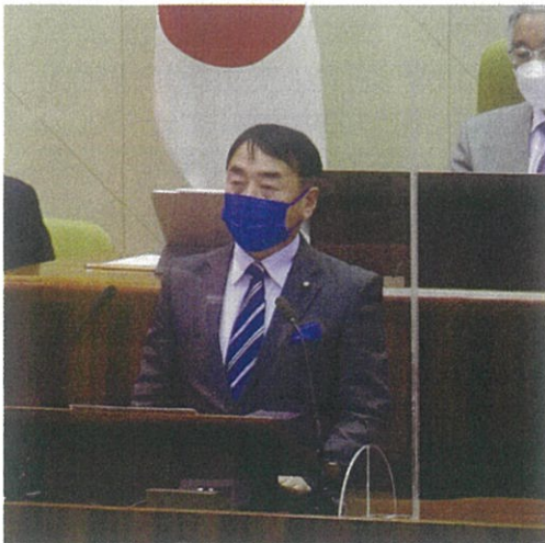
12月定例会で一般質問