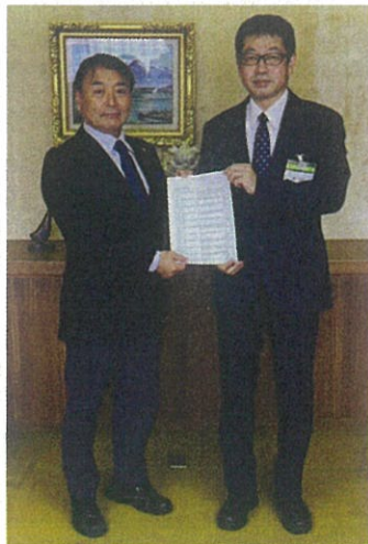
泉区長へ来年度予算の要望