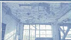
津波が来た教室をそのまま保存。天井は、割かれたまま。