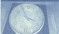
体育館にあった時計は、津波に襲われた15時55分で止まっていた。