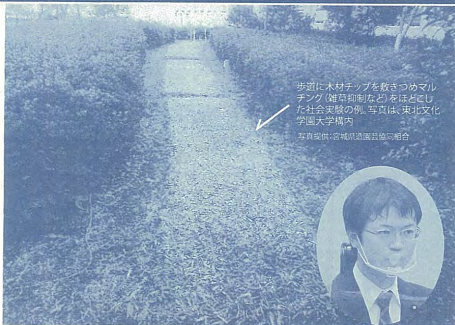
歩道に木材チップを敷きつめマルチング(雑草抑制など)をほどこした社会実験の例。写真は、東北文化学園大学構内