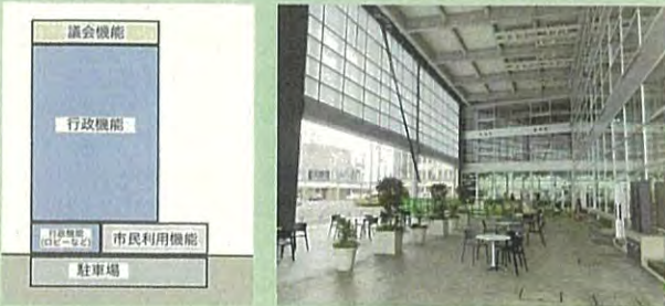
新本庁舎の 機能配置イメージ