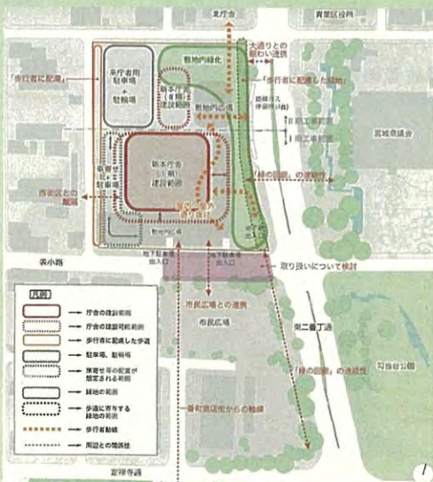
新本庁舎の配置の考え方