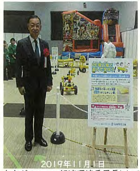
本市ガスフェア 経済環境委員長として

本市としましては、国内外の旅行自粛の動きが日増しに顕著になりつつあることから、地元事業者の皆様の状況を逐次把握し、各種の支援制度を案内するなど丁寧な支援に取り組めます。また、関係機関と連携を密にしながら、将来の事態収束を見据えたさまざまな対策を講じることで、本市の交流人口の早期回復に力を尽くしてまいります。