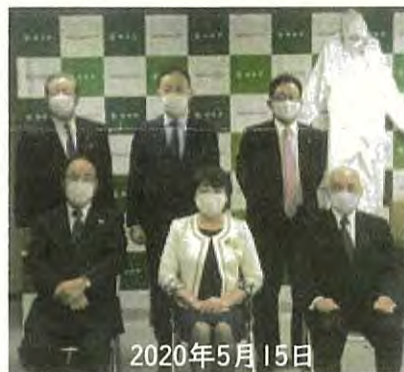
台南成大RCより仙台市への防護服・ゴーグル贈呈に協力

これまで災害復旧制度は原形復旧が基本でしたが、それにとどまらず、地方単独事業として実施する河川等の防災インフラの整備に活用できる交付税措置のある地方債も創設されており、担当局から予算要求があった場合にはこういった国の支援策も活用しながら適切に対応してまいります。