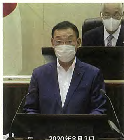
2020年8月3日 令和2年第2回臨時議会 本会議

青葉区の議員有志とともに、東北労災病院他3病院の統合移転等行わないよう強く求める要望書を宮城県知事に提出。