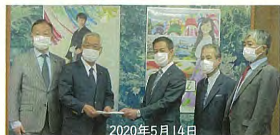
仙台市議会議長への新型コロナウイルス感染症による深刻な影響に対するタクシー事業者への支援要望に協力

景観形成に関する重要事項を調査、審議する仙台市景観総合審議会において、今後の景観施策のあり方につき現在審議していただいています。その中でも今後どのようなものを指定し、保全していくべきなのか、改めて検討が必要とのご意見もあったことから、今後仙台の景観のシンボルを新たな視点で捉え直し、指定候補の拡充について検討してまいります。