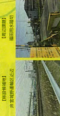
【移設候補地】 JR 宮城野運輸区近辺

※今年2月に仙台市とJR 東日本で、JR 福田町駅の現位置での改修は困難であるとの共通認識に至り、駅移設の方向で協議が取り交わされています。