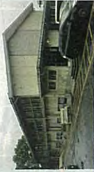
福室小中学校体育館

答 福室小中学校につきましては築50年を超え老朽化が進んでいることを認識しております。今後他校の状況も踏まえ優先度を考慮したうえで対応してまいります。