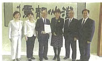
社民党会派で新型コロナウイルス感染症対応に関する申し入れ