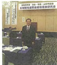
仙台・福島・山形3市議会広域観光連携協議会研究会（山形市）