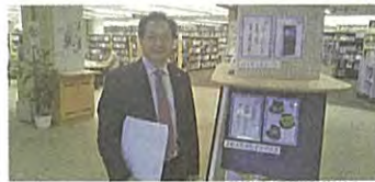
仙台市・富谷市広域行政協議会他都市視察で神戸市、明石市（あかし市民図書館）へ