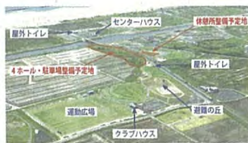
公式大会開けるパークゴルフ場拡張計画進む