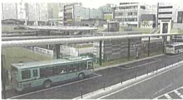
社民党市議団が求めたJR仙台駅西口バスプール拡張で一部供用開始