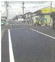
長年の地域要望に応え、山の寺2丁目道路改良と側溝整備実現