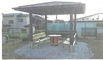
住民が憩う東屋が向陽台5丁目公園に誕生