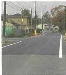
沿道住民の安心・安全を確保する広幡2号線（実沢・小角）改修工事進む