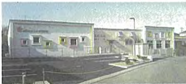
地元の声に応え前向陽台保育所跡地に『はるかぜ保育園』完成