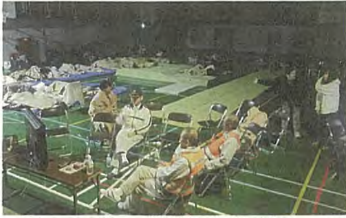
避難所となった燕沢小体育館

が増え、最終的には17組、46人の方が避難してきました。2名の運営担当の市職員に加え、各町内会長とつじ議員も運営にかかりました。