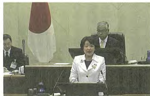
本会議で議案提案を行う郡市長

令和元年仙台市議会第3回定例会は、9月19日から10月23日まで開かれ、平成30年度