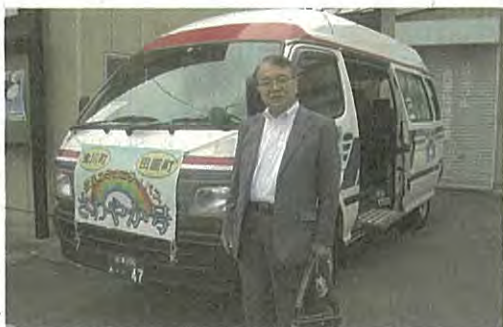
会津若松市の地域交通「さわやか号」

燕沢地区の地域交通「のりあい・つばめ」の試験運行を成功させるために、他都市の先進的事例の視察を実施することとなり、6月27日に会津若松市を訪れました。参加したのは、都市整備局公共交通推進課職員とコンサルタント