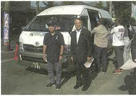
高砂タクシーに変更した「のりあい・つばめ」

4月から9月までの2回目の試験運行は、1日8便、水・金の週3日で、ルートも仙台オーブン病院やJR東仙台駅までの延長も図られました。運賃200円は1回目と一緒に、回数券や定期券も発