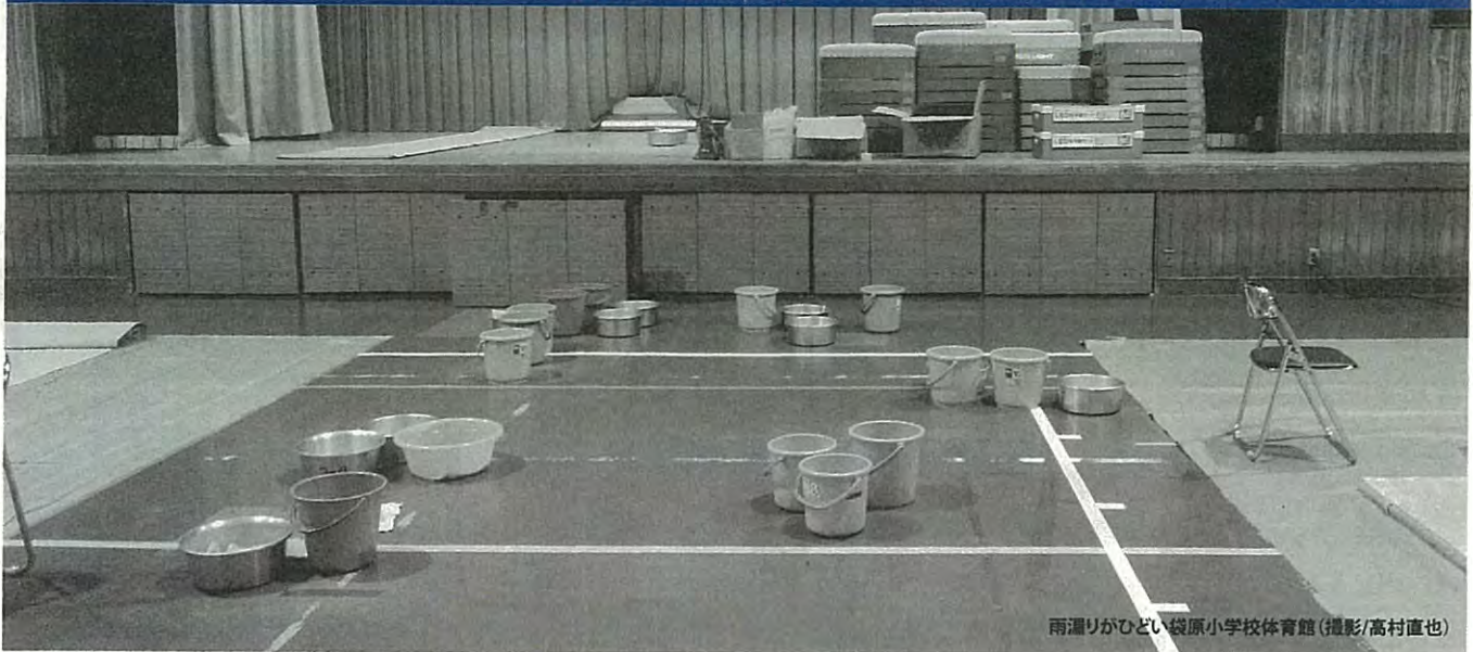
雨漏りがひどい袋原小学校体育館