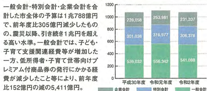
総額(全会計)の推移 (単位:百万円)

◎詳しくは仙台市教育委員会学校施設課 ☎022-214-8864 仙台市市民局地域政策課 ☎022-214-6130