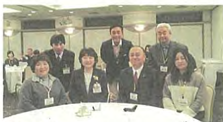
2020年1月 仙私幼PTAと仙私幼連合会共催の 市長を囲む教育懇談会において。

A 【子供未来局長】幼稚園からは無償化の導入後、事務の煩雑化や事務量の増加に関するご意見等をいただいております。事務の効率化の観点から書式の電子化やインターネットを活用した書類の提出などは、有効であると考えており、事業者の方々のご意見も伺いながら検討します。