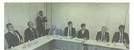
2018年10月 外国人材の介護現場での受け入れ状況を確認するため、関係者と先進の取り組みを行う横浜市役所・特別介護老人ホームでヒアリングを行いました。

A 【健康福祉局長】指定都市が地域の実情に応じた主体的な取り組みが可能となるよう、指定都市への配分枠を確保することを、指定都市市長会を通じ国に要望しております。引き続き、本市の独自利用が可能になるような要望と、県にも柔軟な運用を求めて参ります。