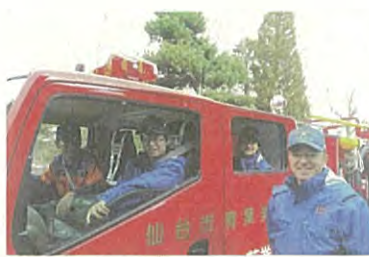
2020年1月 火災予防の広報活動に 従事する学生消防団員と。