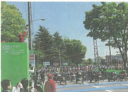
2019年5月 昨年の仙台国際ハーフマラソン大会より (車いすの部スタートの様)

A 【健康福祉局長】参加者数の増加 に向け、競技者対象に新たに作成 したレースのダイジェスト版動画により本 大会の魅力を発信するなど広報啓発にも 努めます。