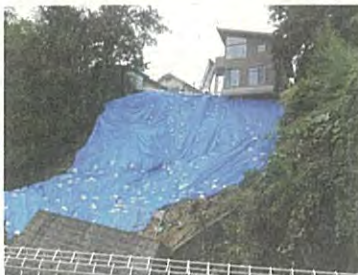
2019年10月 台風19号(令和元年東日本 台風)による双葉ヶ丘町内の 被災状況

A 【危機管理監】さらに実効性を高める ため自主防災組織や町内会と連携し、災 害時要配慮者、高齢者の避難誘導 を含め実践的な訓練が実施できるよう支 援します。