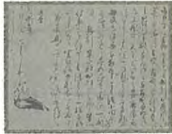
「伊達政宗書状(自筆)宛所不明 天正18年(1590) 仙台市博物館蔵」

国の文化審議会はこの度、国宝及び重要文化財の指定について、文科相に答申いたしました。今回重要文化財となる資料の中に、仙台市博物館所蔵の「伊達家文書」「伊達家印章」が含まれております。伊達家文書は総数約11,300通のうち1,046通が、また伊達家印章は仙台藩主13人のうち12人の印章127点、印譜44点(印影を集めた文書)が指定される予定です。文書には小田原参陣の際の、政宗公自筆書状も含まれています(写真)。これらの資料は4月1日～5月31日の日程で、指定記念特集展示が予定されています。