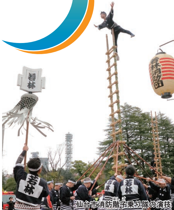
仙台市消防階子乗り隊の演技