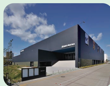
新たにアイスリンクが整備される予定のゼビオアリーナ仙台

答 西公園は順次再整備を進めており、勾当台・定禅寺通りアリアや青葉山エリア等で進行中の各プロジェクトと連動した回遊拠点としての魅力向上に向け、官民連携の取り組みの検討を進めている。本年度末に実施予定の民間事業者との対話を踏まえ、本庁舎の建て替えや音楽ホー