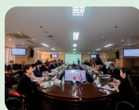
本市と観光に関する相互協力協定を締結しているタイ国政府観光庁訪問の様子

問 敬老乗車証の負担増額は利用控え、高齢者の介護予防も弱まりバス事業者の経営悪化につながる。説明も不十分な中、強行はやめるべき。