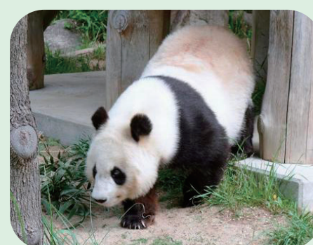
市長が中国の国家主席に親書を送り誘致を希望したジャイアントパンダ

答 本市、東北地方の復興のシンボルとしてジャイアントパンダの誘致に取り組んでいる。その他の主な質疑項目 ○求めた、国際規格の通年型アイスリンク整備への大きな一歩 ○市民の移動手段を確保する視点に立った地域公共交通の取り組み ○公選職である市長、議員の期末手当の引き上げはお手盛りでなく