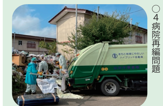
災害廃棄物処理のため令和5年9月にいわき市へ派遣された本市職員

問 職員の災害対応能力の向上が重要な課題として問われる中、災害廃棄物処理のため、令和5年7月に秋田市、同年9月にいわき市へ本市職員の派遣が行われた。これに対する評価を伺う。