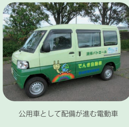
公用車として配備が進む電動車

答 本市の温室効果ガス排出量は削減目標を上回る推移で減少しているが、国の削減目標の大幅な引き上げを踏まえ、地球温暖化対策推進計画等の改定作業を進めている。また、令和4年度末の特殊車両等を除いた公用車914台のうち、電動車は169台となつて