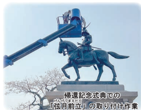
帰還記念式典での「弦月前立」の取り付け作業