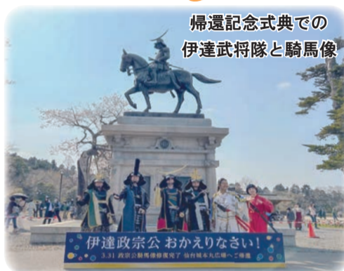
帰還記念式典での伊達武将隊と騎馬像