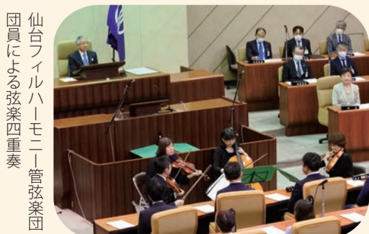
仙台フィルハーモニー管弦楽団員による弦楽四重奏

市役所新本庁舎の整備に向け、議事場の解体を行います。役目を終える議事場の歴史に敬意を表するため、旧本会議場で関係者のあいさつや仙台フィルハーモニー管弦楽団員による演奏等のセレモニーが行われました。