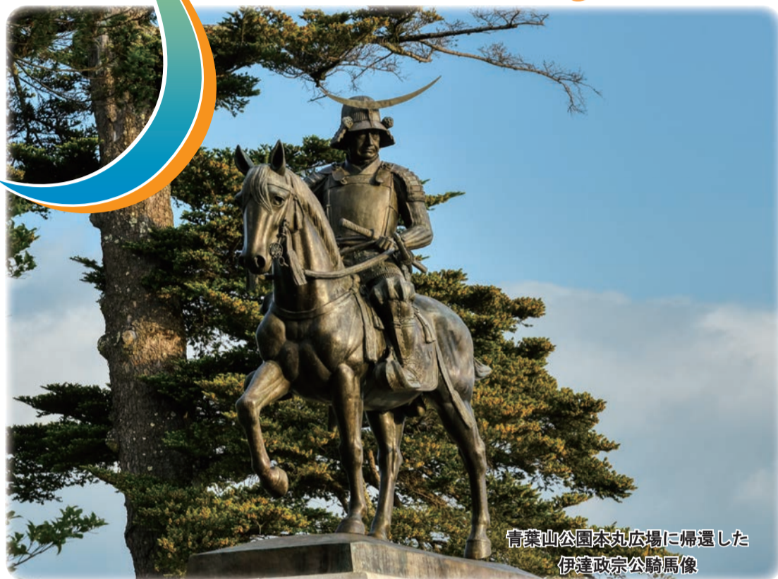
青葉山公園本丸広場に帰還した伊達政宗公騎馬像