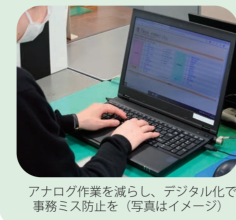
アナログ作業を減らし、デジタル化で事務ミス防止を(写真はイメージ)

答 業務の効率化のため各種事務フローを構築するには、マニュアルの見直しと併せ、システム等を改善し、アラートの発出や自動化などの対策の検討が重要と認識している。このような視点から、現在開発を進めているシステムに