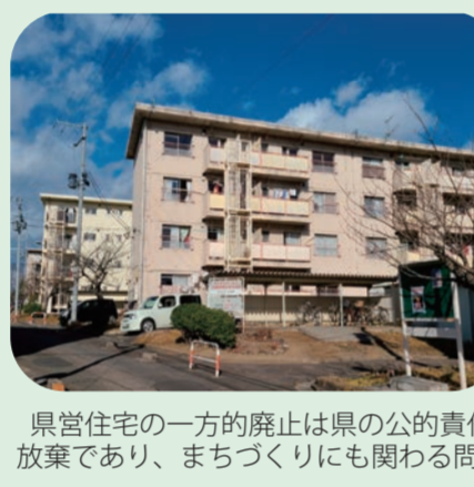
県営住宅の一方の廃止は県の公的責任放棄であり、まちづくりに関わる問題

○子ども医療費助成の拡充を急げ ○県に県営住宅廃止を撤回せよ、建て替えや維持修繕を求めよ ○高過ぎる国保料の引き下げ ○独自の給付制奨学金制度の創設 ○新たな学生フリーパスでは、従前の価格で地下鉄を対象に ○学校の特別教室にもエアコンを