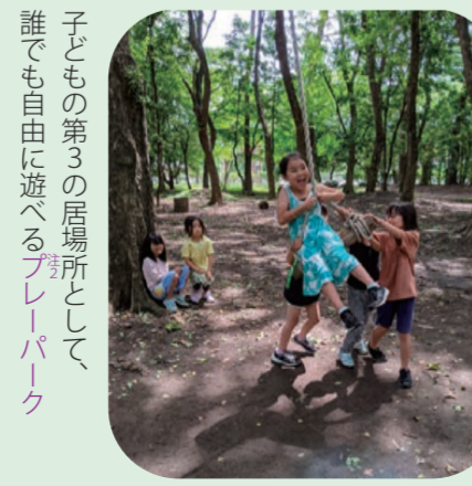
子ども第3の居場所として、誰でも自由に遊べるプレパーク

答 会合の関連事業ではAI研究の第一人者である女性研究者による講演もあり、科学技術分野でも女性の活躍がますます期待される。今後、市内の小中学生向けにロールモデルとなりうる研究者をリーフレット等で紹介する予定であり、