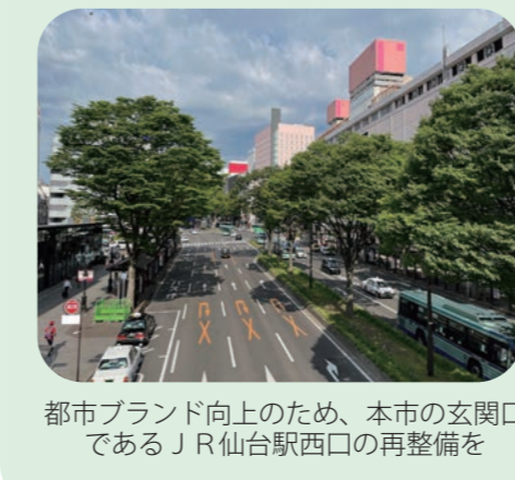
都市ブランド向上のため、本市の玄関口であるJR仙台駅西口の再整備を

答 昨年度から、若い世代の本市への定着に加え、既存住宅団地の世代更新を図ることで地域コミュニティの維持も目的とした事業を開始した。この事業は2年目であり、まずは事業をしっかりと