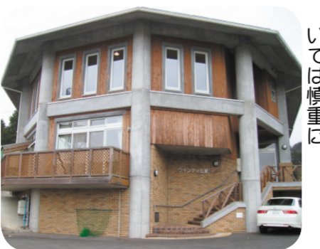
精神障害者生活訓練施設「ウィンディ広瀬川」(青葉区三居沢)

また、小規模地域活動センターをどのように支援し、実効性のある就労支援を行っていくのか。 問 精神障害者社会復帰施設は、平成二十二年度末までに障害者自立支援法に基づく新体系施設に移行するが、利用者や施設運営者に経済的なデメリットは発生しないのか。 答 新体系施設に移行すること、所得区分に応じ、利用者にとっての負担が生じることがある。利用料の見直しにより通所系サービスの負担上限額が低減されたところである。小規模地域活動センターは、精神障害者の地域生活を支援する上で重要であることから、現行の補助水準を維持していく。