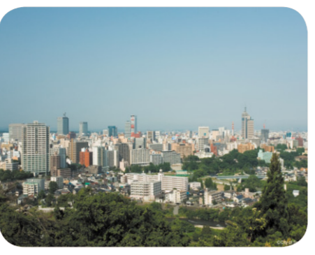
新総合計画の策定により人口増加誘導策を

や仙台市圏を含めた企業誘致、地域産業の活性化に取り組むこともに歴史、文化、景観などの仙台の資源の輝きを増すことで人が集まり、定住に結びつけられるものと考えている。 問 世界的な経済不況の中、本市での雇用対策、中小企業対策、障害者就労対策 答 雇用の確保と中小企業対策は、緊急的な雇用対策を確実に行うとともに、若者向けの新たな雇用対策を検討するなど地域経済の活性化に最大限努めたい。また、障害のある方の就労支援は、一般企業等における障害者雇用を促進するため、実習訓練や職場定着を支援する施策等の推進を図っており、今後さらに取り組みを充実・強化していく。