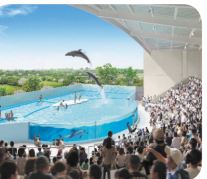
新水族館の展示イメージ図

行ってまいりたい。 その他の主な質疑項目 ○市長公約である音楽ホール建設構想の取り組み ○仙台駅周辺の交通結節機能の充実と東西連絡道路の拡幅 ○あすと長町整備事業の現状と今後 ○新市立病院の外観と地下鉄南北線駅からのアクセス計画 ○介護老人施設の早急な整備を ○新設児童館の運営と地域連携