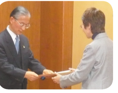
宮城県信用保証協会へ円滑な中小企業の資金調達への協力を要請する

このマッチングを行い、インターンシップに働きながら将来の正規就労へとつながるような支援策を検討するなど、最大限努力する。 問 (仮称) みやぎ環境・エネルギー導入には市民理解が不可欠 答 宮城県信用保証協会へ円滑な中小企業の資金調達への協力を要請する