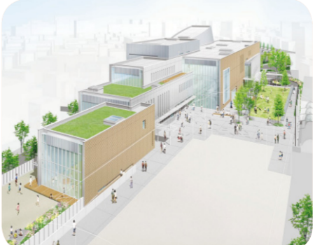
(仮称) 宮城野区文化センター完成イメージ図

その他の主な質疑項目 ○松島水族館の事業計画の提示 ○市役所風土の改革として「局・区長への庁内分権」を ○県との連携と女性施策の推進 ○道路占用料改定後の維持管理 ○国による「事業仕分け」の本市への影響