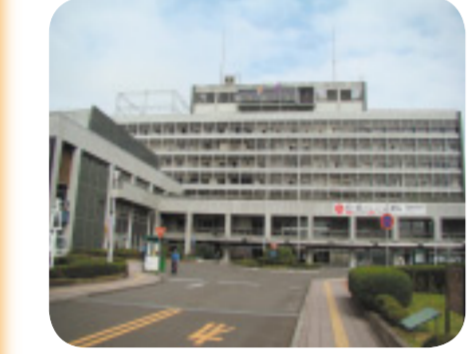
改革が望まれる市役所

答 職員定数削減の目標数については、市民の皆様にも広くお示しするには、より詳しい削減計画を定める必要があると判断し、掲載しなかつた。今後については、こ