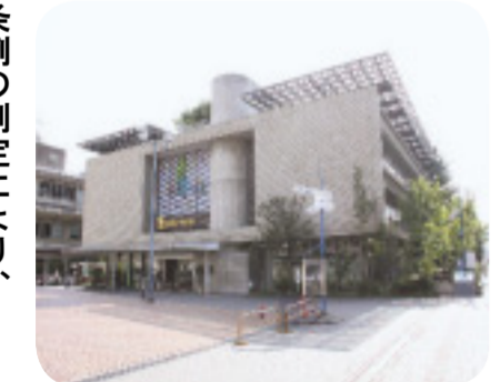
環境保全の実践・学習・地域貢献の役割を担う京エコロジーセンター(京都市)

答 市街地の照度アップ・省電力化や市民利用施設への省エネ機器・技術の導入など、環境と地域経済の好循環を創り出す視点を重視した事業計画を立案していく。