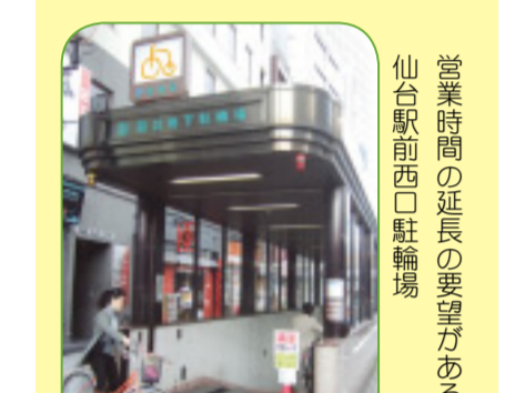
営業時間の延長の要望がある仙台駅前西口駐輪場