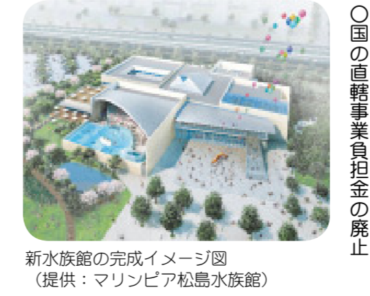
新水族館の完成イメージ図

答 アンパンマンこどもミュージアムの誘致が実現すれば、街にぎわいをもたらす、本市の活性化に大きく寄与すること、東北地方全体の子どもたちに喜ばれること認識している。水族館についても本市における教育・文化施設