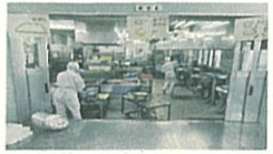
視察した泉区桂小学校

(教育局) それぞれで献立を作成し、食材を発注しておりますことから、その量の集約までは行っていない。調達状況の集約につきましては、地域農産物活用推進の観点からも重要。今後、食材発注に係るシステム改修も含めて検討して参りたいと存じます。