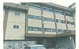
福室小学校は建替え整備がすすみます。

(意見) 自校給食(単独調理方式)導入の要望が福室地区からございます。福室小学校は建替えに向けて整備が進んでいる。要は、調理場を設置する50年に一度のチャンス。前向きに検討をして頂くことをこの場(議場)でもお願いします。(令和5年第2回定例会一般質問)