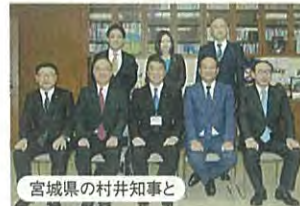
宮城県の村井知事と