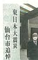
東日本大震災 仙台市追悼

今年も市内各地で東日本大震災の追悼会場が設けられ、そのひとつ若林区文化センターにて参列しました。