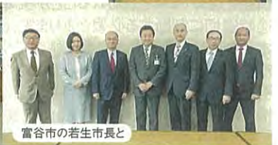
富谷市の若生市長と