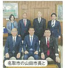
名取市の山田市長と

2022年1月~3月に、宮城県の村井知事、名取市の山田市長、富谷市の若生市長など、会派は近隣自治体の首長との意見交換の様態です。それぞれの立場を超えて、共通課題の把握と今後の方向性を確認しました。今回の自治体にとどまらず近隣自治体との対話を継続する予定です。