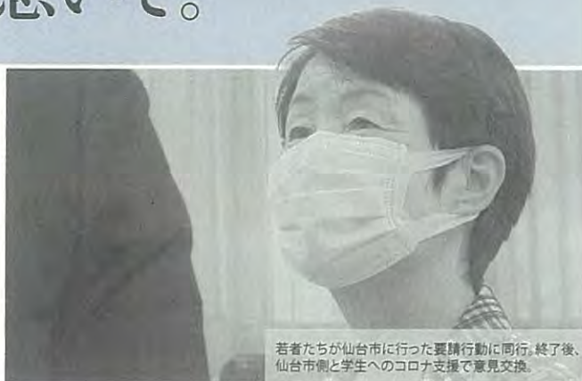
若者たちが仙台市に行った要請行動に同行。終了後、仙台市側と学生へのコロナ支援で意見交換。

もう自公政権では、ムリです。 命と暮らしを守る 新しい日本 を展望しながら、 切実な声を取りあげました。