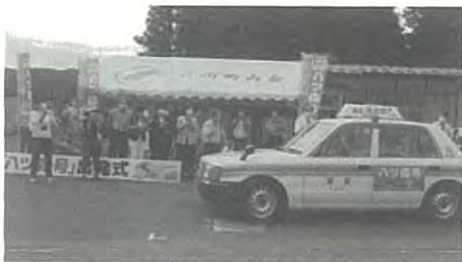
ワクチン接種に伴い臨時便を運行している乗合タクシー「ハツ森号」

高見議員「市が地域交通事業として取り組んでいる、愛子地区のセダントタイプの予約制乗合タクシー『ハツ森号』は、コロナワクチン接種に伴い臨時便を運行し、自宅前から個別接種の会場まで直結するようにし、喜ばれている。大崎市では、タクシー事業者と協定を結び片道上限600円、2回往復で2400円まで助成。白石市では、巡回バスやジャンボタクシーを無料で運行するなど移動支援策を打ち出している。仙台でも、接種会場は遠すぎて行けないなどの声が上がっている。本市でもワクチン接種を支援するため無料送迎バスを出したり、タクシー助成を行うなど提案する」