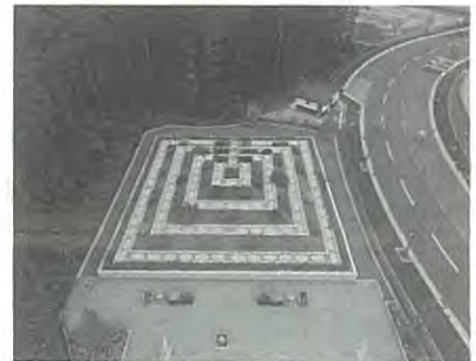
いずみ墓園にある個別集合墓所。小山型のお墓の土中に個人専用の納骨室(30cm四方)を設置した集合墓所。後継者を必要としない墓所=写真は、仙台市発行のパンフレットから

健康福祉局長「市民の心配事として、管理料が高い、お墓を守り続けられるか不安など、考え方が多様化している。現在、より安価で継承者を必要としない合葬式の墓所を、いずみ墓園に整備することを検討している。個別集合墓所も含め、今後の整備に反映したい」