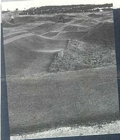
福島・新地町のパンptrack