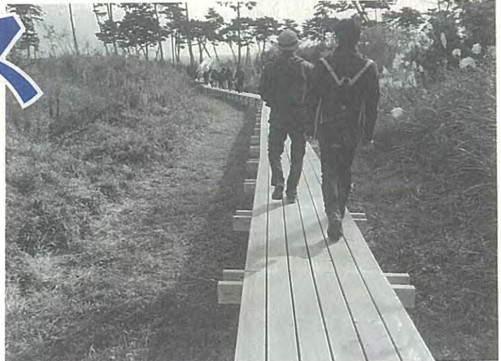
新浜フットパス(11月21日)。木道も整備され、参加者たちは、海風のなか気持ちのよい汗をかいた

宮城野区長「こうした取り組みは、地域の魅力、復興の様子を発信するうえでも役割を果たすもの。位置づけて、海浜エリアの賑わいづくりを進める」