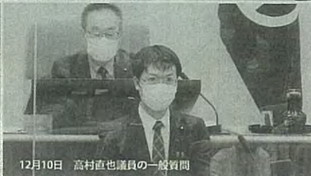
12月10日 高村直也議員の一般質問