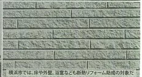
横浜市では、床や外壁、浴室なども断熱リフォーム助成の対象だ