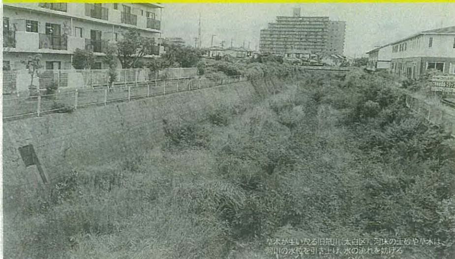
丸木が生い茂る旧策川(太白区)。河床の土砂や草木は、河川の水位を引き上げ、水の流れを妨げる