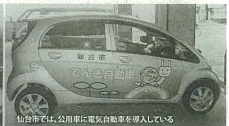
仙台市では、公用車に電気自動車を導入している