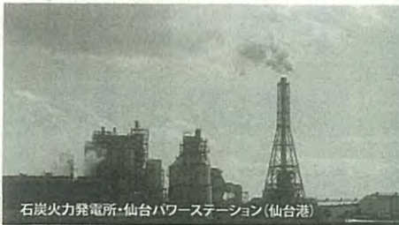
石炭火力発電所・仙台パワーステーション(仙台港)