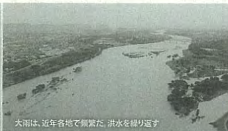
大雨は、近年各地で頻繁だ。洪水を繰り返す