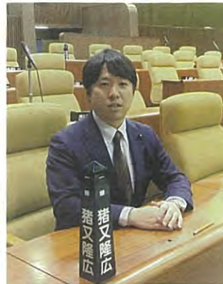
仙台市議会議員 猪又 隆広