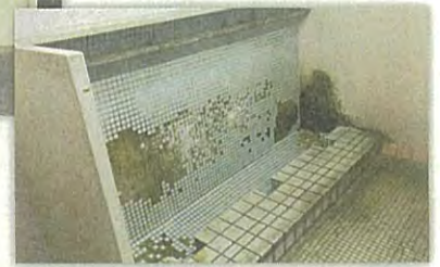
▼現在のトイレ屋内