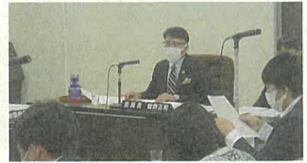
▲市民教育委員会風景