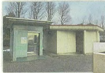
▲現在のトイレ建物