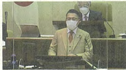
▲第4回定例会最終日 委員長報告