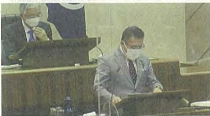
▲第3回定例会最終日 委員長報告