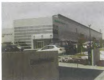
学校給食センター（野村）

私としても、次世代を担う子どもたちの健やかな心身の成長にとって、栄養のバランスがとれた日々の食事は欠かせないものであり、また、食育の観点からも学校給食の役割は大きいと認識しております。今後とも、教育委員会とともに取り組んでまいりたいと存じます。