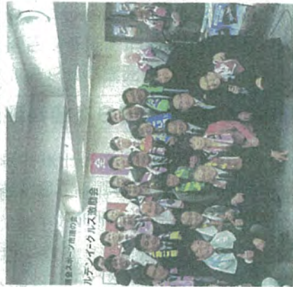
活躍が期待される新人選手