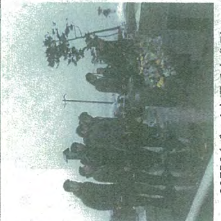
89ERS(バスケ)選手も参列

11日 震災から8年、荒浜海岸で行われた追悼式典に参加。雨の中、大勢の方が訪れました。【写真】