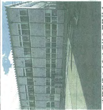
空調整備の大和小学校の仮設校舎