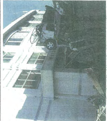
津波の凄まじさを物語る

10日 震災から8年、気仙沼市を訪問。震災遺構の気仙沼向洋高校、当日オープンの伝承館を視察。【写真】