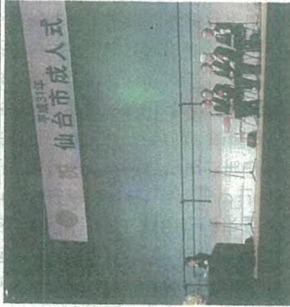
新成人に期待を寄せ