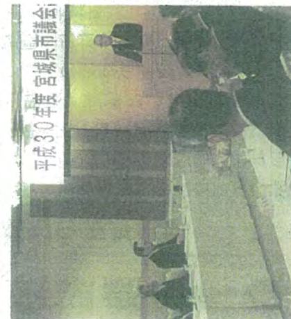
名取市が開催都市

13日 仙台市体育館で開催の成人式に出席。11246人(男性5799人・女性5447人)が成人。【写真右下】