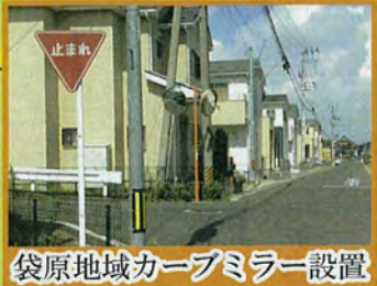
袋原地域カーブミラー設置