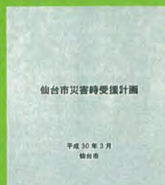
仙台市災害時受援計画 平成30年3月 仙台市