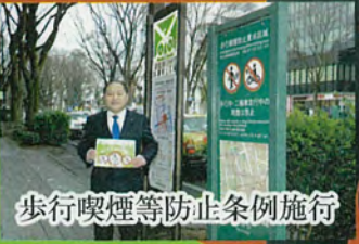
歩行喫煙等防止条例施行