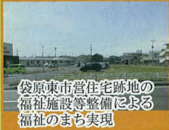
袋原東市営住宅跡地の福祉施設等整備による福祉のまち実現