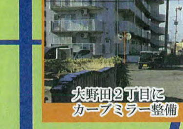
大野田2丁目に カーブミラー整備