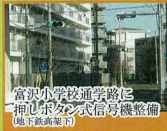
富沢小学校通学路に 押し赤タン式信号機整備 (地下鉄高架下)