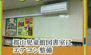
郡山児童館図書室に エアコン整備