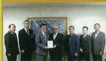
長町西町第一町内会集会所 用地を決定 (町内会要望書提出)