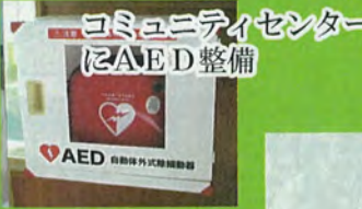
コミュニティセンターにAED整備