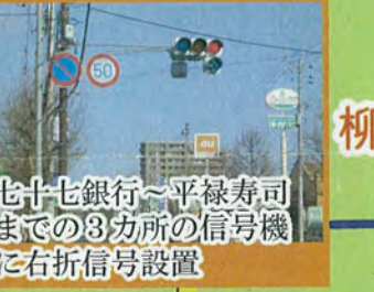
七十七銀行～平緑寿司 までの3カ所の信号機 に右折信号設置