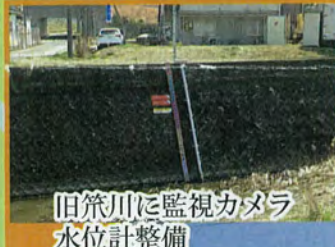
旧策川に監視カメラ水位計整備