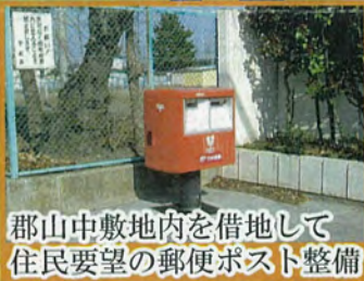
郡山中敷地内を借地して住民要望の郵便ポスト整備