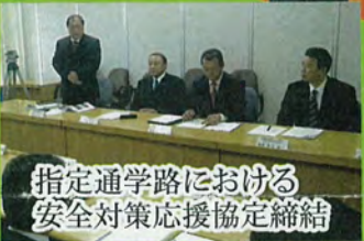
指定通学路における安全対策応援協定締結