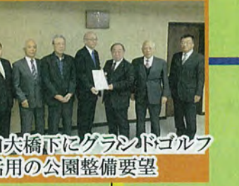
太白大橋下にグラウンドゴルフ 等活用の公園整備要望