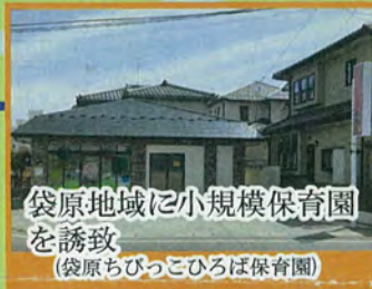
袋原地域に小規模保育園を誘致 (袋原ちびっこひろば保育園)