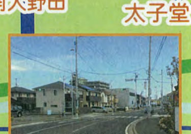
大野田小学校北側に 信号機設置 (町内会要望書提出)