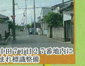
西中田7丁目27番地内に 生まれ標識整備