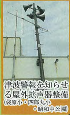
津波警報を知らせる屋外拡声器整備 (袋原小・四郎丸小) ●昭和中公園