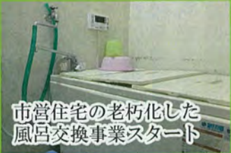
市営住宅の老朽化した風呂交換事業スタート