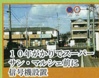
10年がかりでスーパーサン・マルシェ前に信号機設置