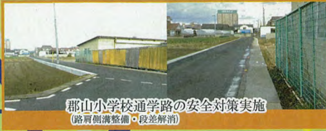
郡山小学校通学路の安全対策実施 (路肩側溝整備・段差解消)