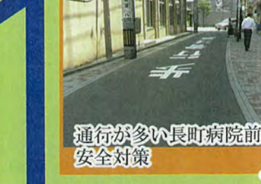
通行が多い長町病院前 安全対策