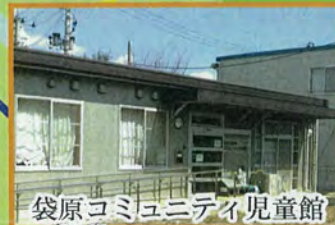
袋原コミュニティ児童館の増設