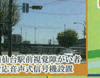
南仙台駅前視覚障がい者 対応音声式信号機設置