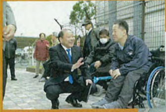
袋原市営住宅バリアフリー化階段に雨天時対応スロープ整備