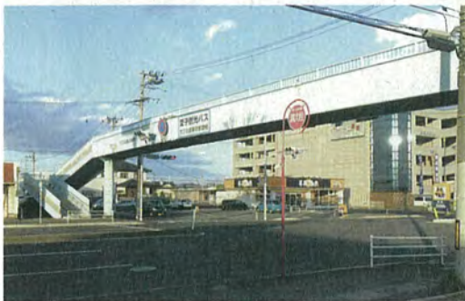
六丁の目第1・第2歩道橋の改修・フェンスの設置