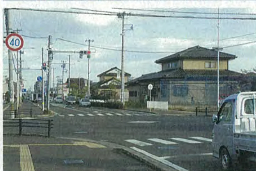
蒲町小学校前 交差点信号機に右折標示を設置