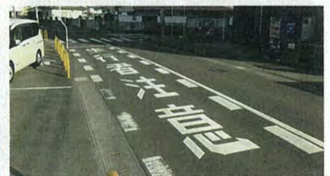
蒲町中学校 通学路交差点の路面表示