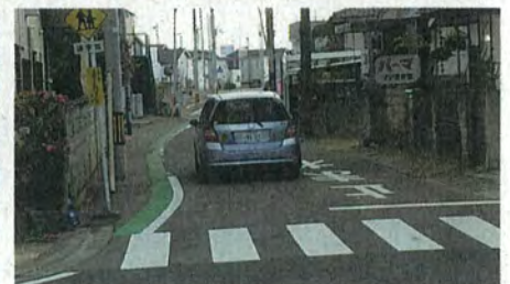
蒲町小学校 通学路の歩行帯の拡幅