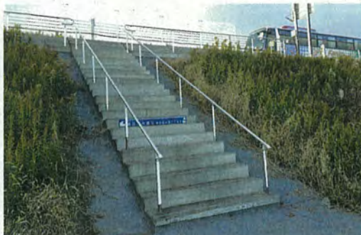
東部道路への災害時用避難階段を整備