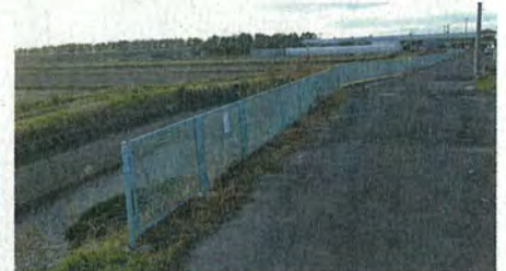
各水路への転落防止フェンスの設置