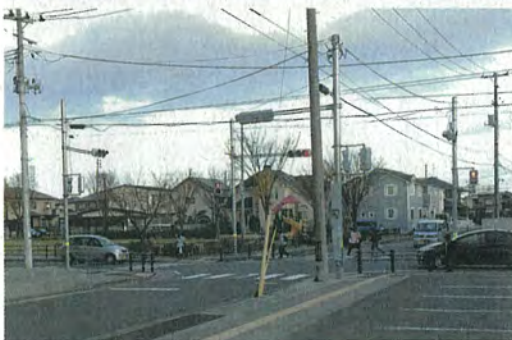
新旧荒井地区の交通量増加に対応し信号機を設置