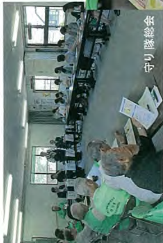
公園清掃 守り隊総会