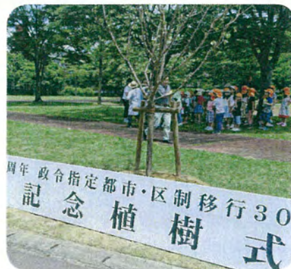
7月2日 七北田公園内に区制移行30年記念の植樹(紅白梅5本)