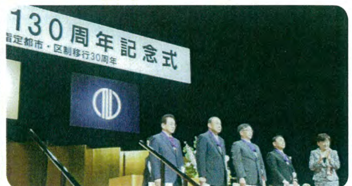
7月1日 仙台市制施行130周年記念式にて同僚議員とともに市政特別功労者章を拝受しました。