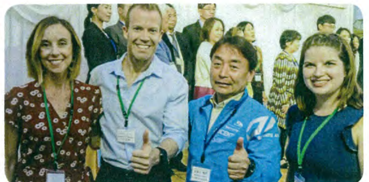
5月12日 仙台ハーフマラソンでは米国ダラス市の選手団と姉妹都市交流。同市とは積極的な経済交流を。