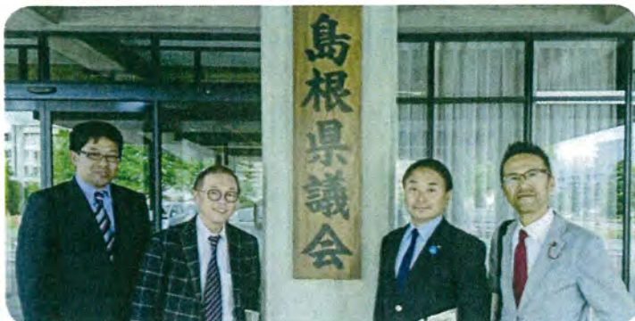
5月8日～10日 会派行政視察。仙台～出雲便を利用して島根県および出雲市を調査。