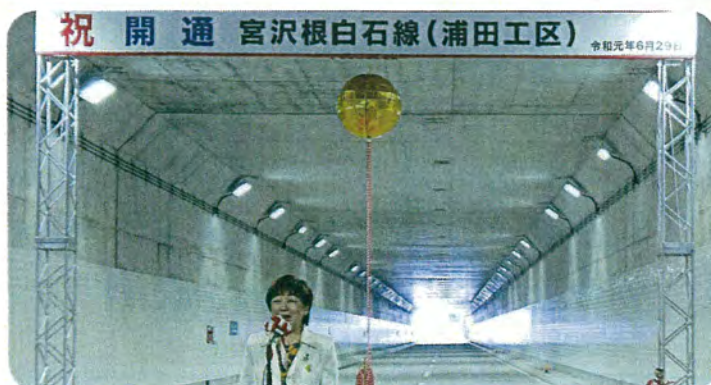
6月29日 宮沢根白石線浦田工区が開通し、北根交差点から4号バイパスが直接つながりました。