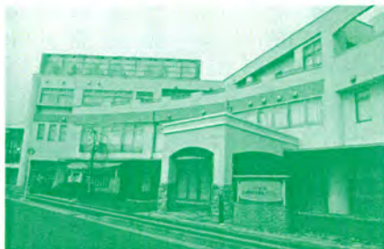
若林区障害者福祉センターの整備