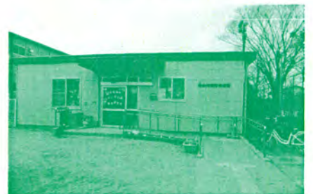
蒲町児童館の建設