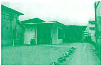
南材児童館の建設