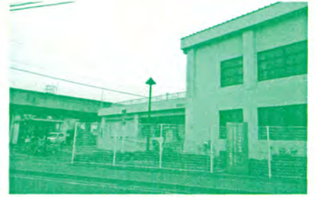
古城コミセンの建設