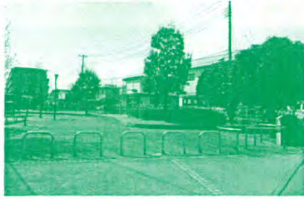
桜木緑地(公園)の整備

議員になってから現在まで、若林区の住みよい街づくりを進めてきました。その成果の一部です。