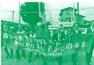
青少年健全育成パレードに参加

● 国際交流の活性化のため、仙台港や仙台空港のセールス活動の強化、海外からの投資、外国人観光客や国際会議の誘致などに努めます。