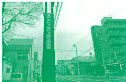
むにゃむにゃ通り商店街の看板を設置