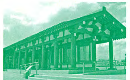
陸奥国分寺のガイダンス施設などの整備