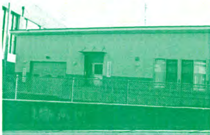
連坊コミュニティ消防センターの建設