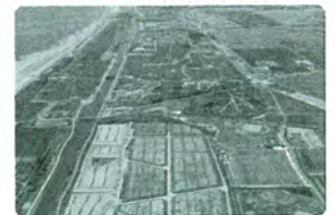
東部海岸部の集団移転跡地