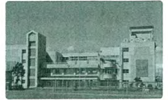
市内有数の大規模校である富沢中学校