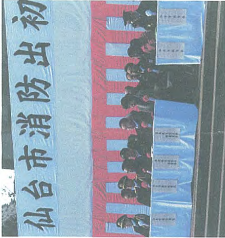
寒風の中恒例の出初式