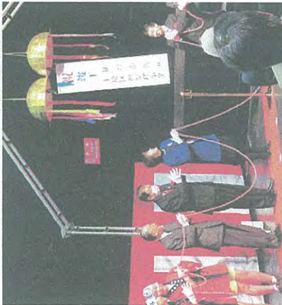
地元のこどもと一緒にくす玉開披