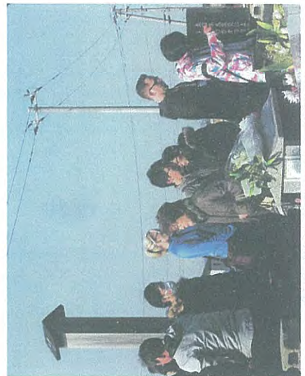
折りを捧げる多数の参列者