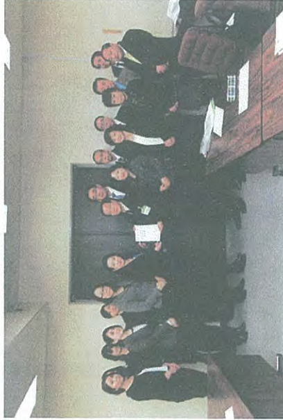
東北親の会代表が申し入れ