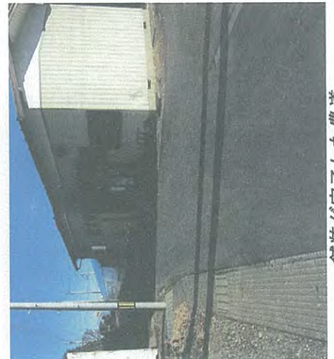
舗装が完了した農道

長喜城地区の方から屋敷前の農道が水はげが悪く、整備してほしいとの要望が昨年ありました。農道のため所管がどこなのか、確認に時間を要しましたが、この度舗装が完了しました。