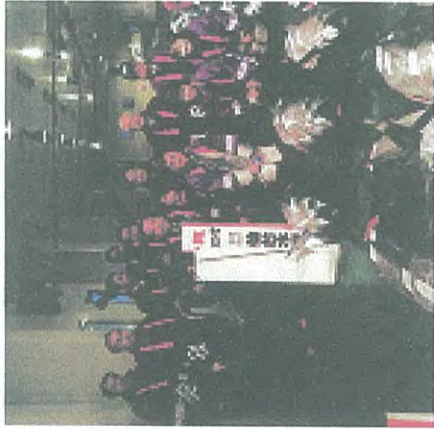
鮮魚部でマグロの初せりを視察