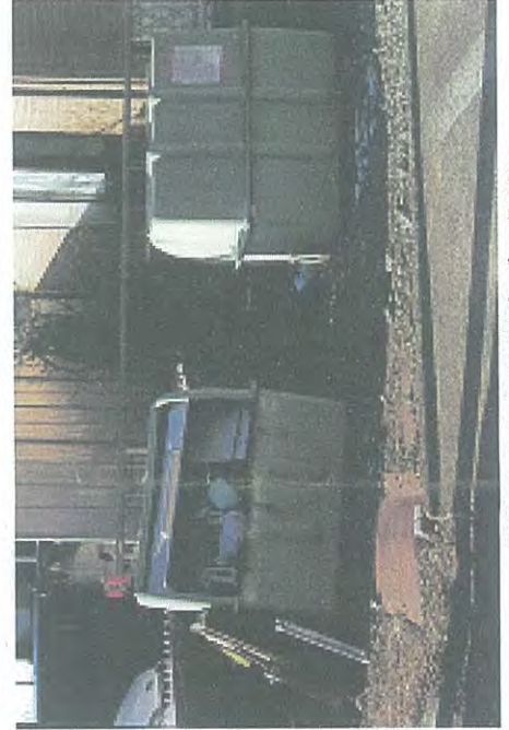
撤去された不法投棄ゴミBOX

大和町5丁目町内の側溝や雨水路にテレビや車いす等が投棄され、また長期にわたりゴミ箱(写真)に不法投棄されており、町内では処理に困っておりました。町内会長・町内会顧問・クリーン推進委員が立会いのもと、2月19日に環境局職員が現地調査を実施しました。張り紙等で警告した上で、3月上旬にゴミの撤去が完了しました。