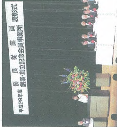
太白区産業ホール