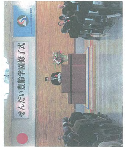
シルバーセンターでの修了式